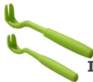
Des pinces à tique