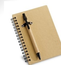
Pour noter des infos utiles (heure accident...)