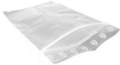
Des sachets plastiques (en cas d'amputation)