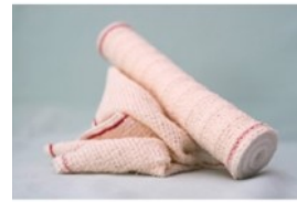
Des bandes de fixation (pour maintenir une compresse)