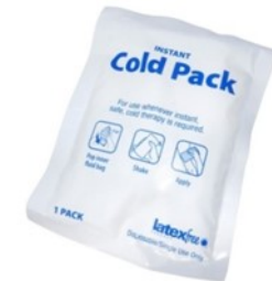
Un cold pack à craquer (hématome...)