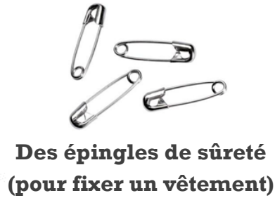
Des épingles de sûreté (pour fixer un vêtement)