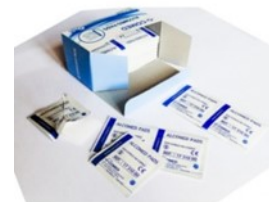
Des lingettes désinfectantes pour nettoyer le petit matériel