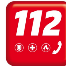
Une liste des numéros utiles