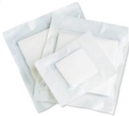
Des compresses de différentes tailles