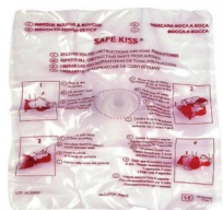
Filtre protection (bouche à bouche)