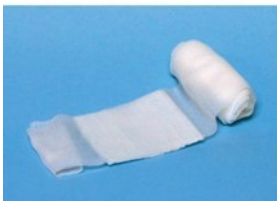
Des pansements compressifs (en cas d'hémorragie)

Agréée par le SPF Emploi, Travail et Concertation Sociale